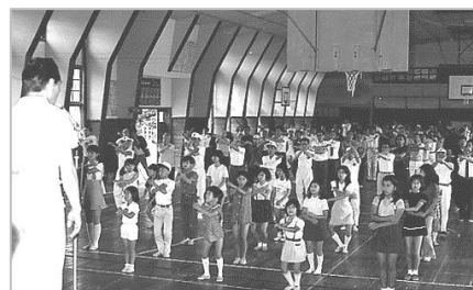
▲朝のラジオ体操の集い(順化小) 昭和48年 66514