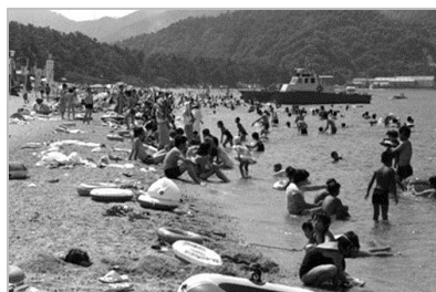
▲松原海水浴場 昭和56年 70972

これまでに発行した資料叢書や研究紀要などを配布しています。申込みは閲覧室カウンターまで。